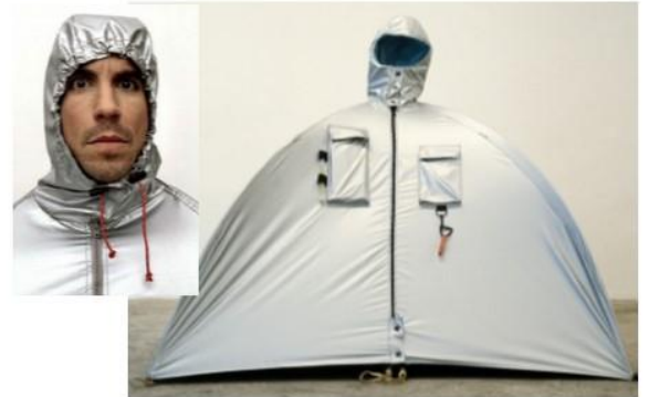
Lucy ORTA Les Refuge Wear dès 1992.

Hybridation du vêtement et de l'architecture minimale de la toile de tente le vêtement, en déployant sa fonction de refuge, s'ampute simultanément de celle de lien