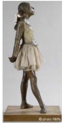
Edgar DEGAS Petite danseuse de 14 ans 1880 Bronze et Tutu H 95 cm

Degas innove, c'est un précurseur. Il ajoute un objet réel , un vêtement à sa sculpture de bronze, Il l'habille Il crée le premier assemblage . Il apporte la confrontation entre représentation et réalité. Le vêtement apporte un surcroît de réalité . L'œuvre fait scandale à l'exposition impressionniste de 1881