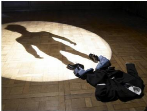
Philippe RAMETTE L'ombre de moi-même 2007 Installation lumineuse, technique mixte

L'œuvre est classée dans le mouvement hyper-réalisme.. (illusionnisme, trompe l'œil)