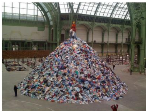
Christian BOLTANSKI Persomes 2010 Installation dans les 13500 mètres carrés du Grand Palais à Paris 50 tonnes de vêtements usagés