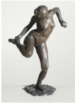
Edgar DEGAS Danseuse regardant la plante de son pied droit 1895 Bronze H 47 cm Etude vie quotidienne

Sculpture composée d'un seul matériau, le bronze