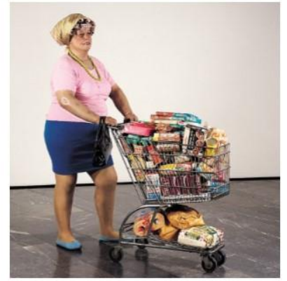
Duane HANSON Supermarket Lady 1969 Fibre de verre peinte, polyester et objets. Vêtements. 66 x 70 x 70 cm

Degas innove, c'est un précurseur. Il ajoute un objet réel , un vêtement à sa sculpture de bronze, Il l'habille Il crée le premier assemblage . Il apporte la confrontation entre représentation et réalité. Le vêtement apporte un surcroît de réalité . L'œuvre fait scandale à l'exposition impressionniste de 1881