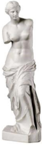
Venus de Milo 100 avJC 2mètres marbre Grèce Antique, Musée du Louvre, Paris

Sculpture composée d'un seul matériau le marbre. Sculpture monolithique , faite d'une seule pierre, qui forme un tout homogène, cohérent