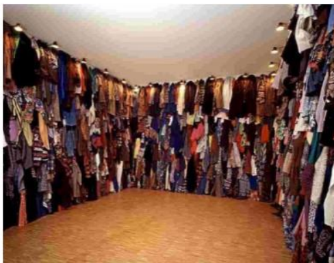
Christian BOLTANSKI Réserve vers 1889 Installation Vêtements

Hybridation du vêtement et de l'architecture minimale de la toile de tente le vêtement, en déployant sa fonction de refuge, s'ampute simultanément de celle de lien